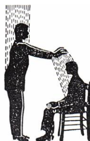
O passe recebido com fé irradia-se por todo o organismo